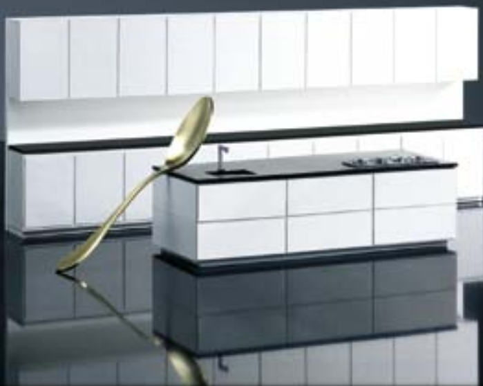
1114 Nero Assoluto, Collezione Base

OKITE® har satt en ny standard i världen på kvartskomposit och kan matcha alla dina behov.