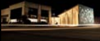
Seieffe Industrie di Montesarchio (BN)

Från mätning till montering, hela OKITE® kedjan arbetar proffsigt för att kunna erbjuda er det bästa.