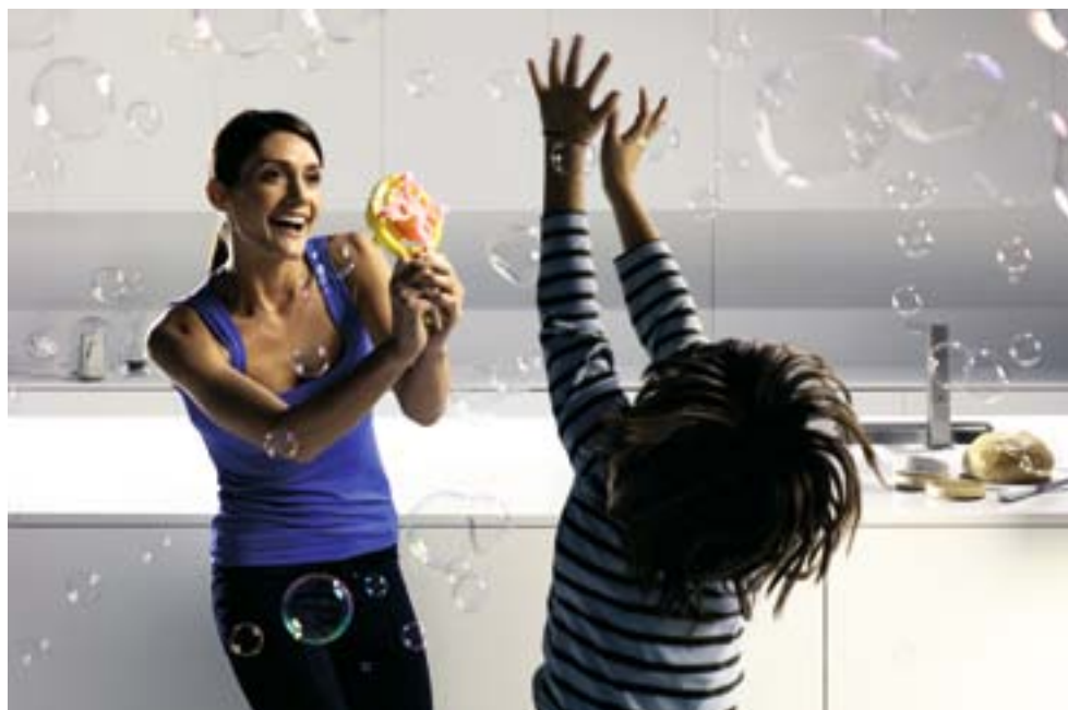
1665 Bianco Assoluto, Collezione Base

Det är därför OKITE® ger maximal hygien för dig och din familj!