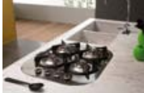
1896 Bianco Carrara, Collezione Venati